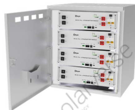
Встановлення в стійку