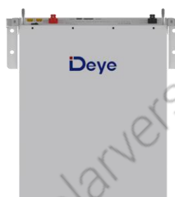
Встановлення на стіну