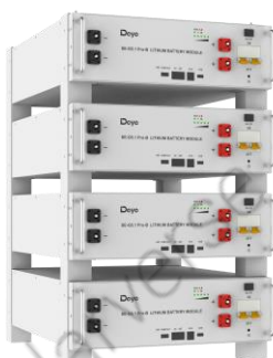
Встановлення на підлогу